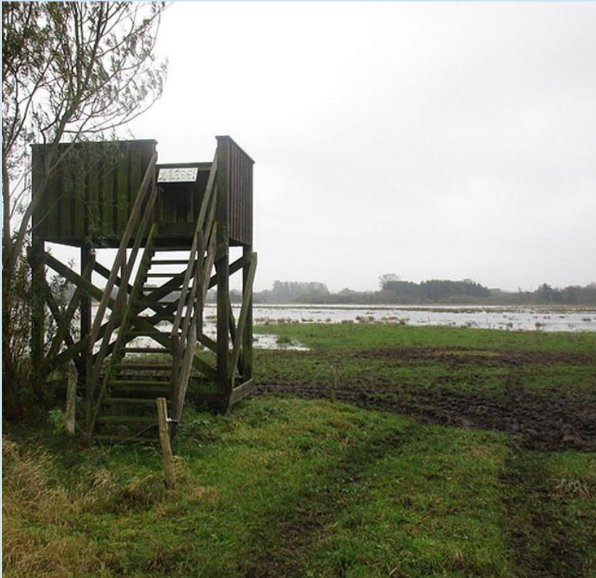
Vådområder [72 pct]