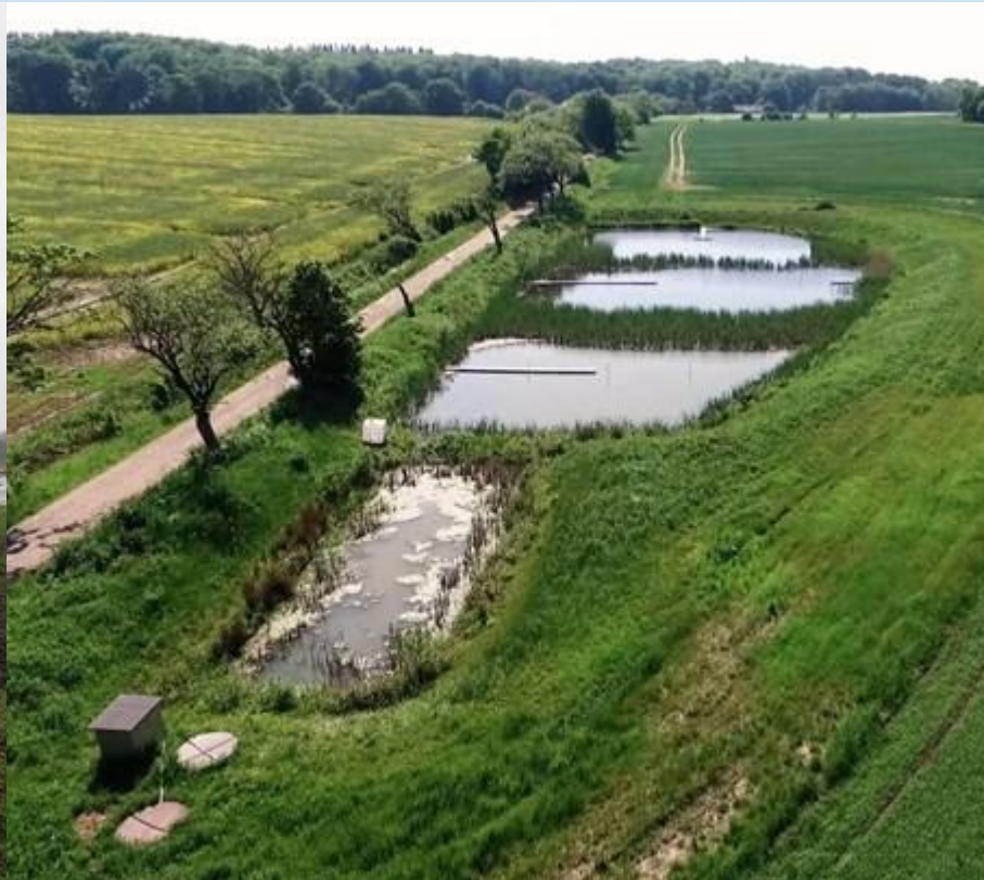
Minivådområder [5 pct]